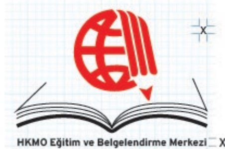
Şekil 2. EBM Logosu Ölçüleri